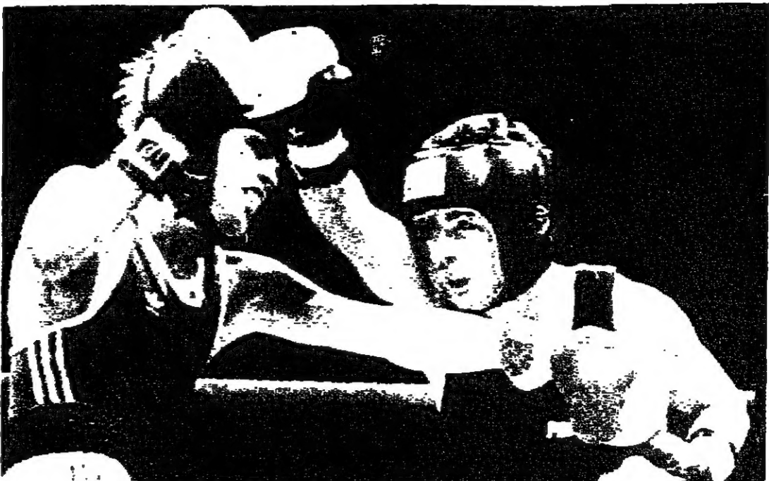
الأميركي سرجيو ريسيس والسوفياتي فلاديمير فلاديميروف أثناء مباراةهما في وزن الذبابة (دويتز)